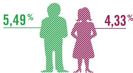
En pourcentage de patients dépistés et traités parmi les 59 millions de personnes couvertes par le régime général de l'Assurance Maladie et des sections locales mutualistes (SML).

■ Une affection chronique courante et plutôt masculine. . .